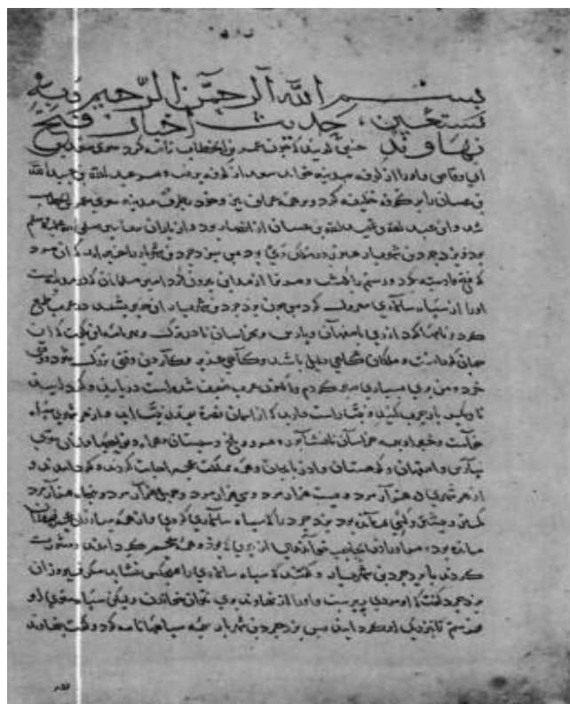
Рис. 1 Тарих-и Табари, л. 1186.

Список под номером 7293 (234 листа) содержит восьмой том сочинения.