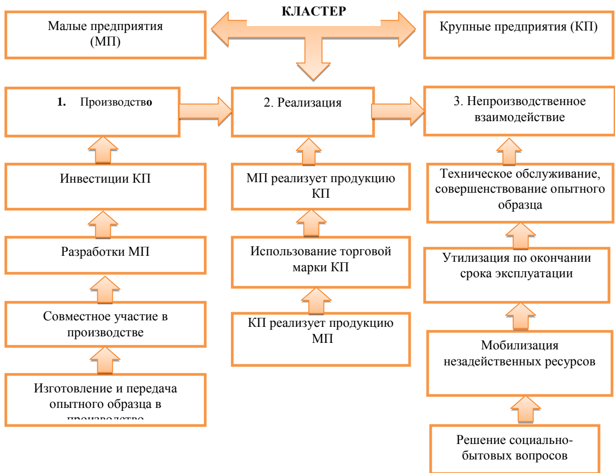
Рисунок 1 – Модель взаимодействия крупного и малого бизнеса на основе кластеризации

В Казахстане уже сформированы определенные предпосылки для создания аналогичных кластеров. Дело в том, что достижение эффективной реструктуризации территориально-промышленных комплексов предполагает тесного взаимодействия между крупным, средним и малым бизнесом, их партнерства с высшими учебными заведениями и исследовательскими организациями. И здесь применение кластерного подхода предоставляет необходимые инструменты, позволяющие достигнуть взаимовыгодных интересов сторон. Казахстанские кластеры, имеющие наиболее высокий потенциал, создаются в отраслях металлургии, нефтехимии, информационных технологий, машиностроения, легкой и пищевой промышленности и т.д.