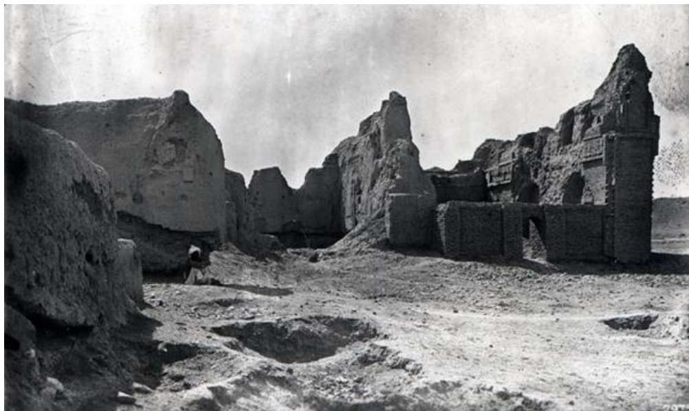
Рисунок 2 – Руины медресе-низамийя в Харгирде (Иран) [5]

1) использование государственного бюджета при основании медресе-низамийя. До Низам аль-Мулька почти все медресе создавались частными лицами на их личные средства. Персидский визирь же вывел проблему строительства медресе на государственный уровень. Многие низамийя основывались и содержались за счет государственной казны. Например, турецкий историк М. А. Кёймен, ссылаясь на средневекового мусульманского автора Туртуши (Turtuşi – Е. А.), указывает сумму в 600 000 динаров, которые ежегодно тратились на содержание ученых, слушателей, медресе и т.д. [6, с. 350, 353]. Хотелось бы отметить, что сам Великий визирь жертвовал 1/10 своего жалования, выплачиваемого ему из доходов султана, на строительство медресе [6, с. 353-354].