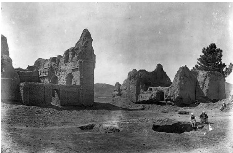
Рисунок 1 – Руины медресе-низамийя в Харгирде (Иран) [4]

Как выглядели медресе-низамийя, можно представить себе в общих чертах благодаря нижеприведенным фотографиям их руин в Иране, сделанным еще в 1925 г. немецким археологом-иранистом Э. Герцфельдом.