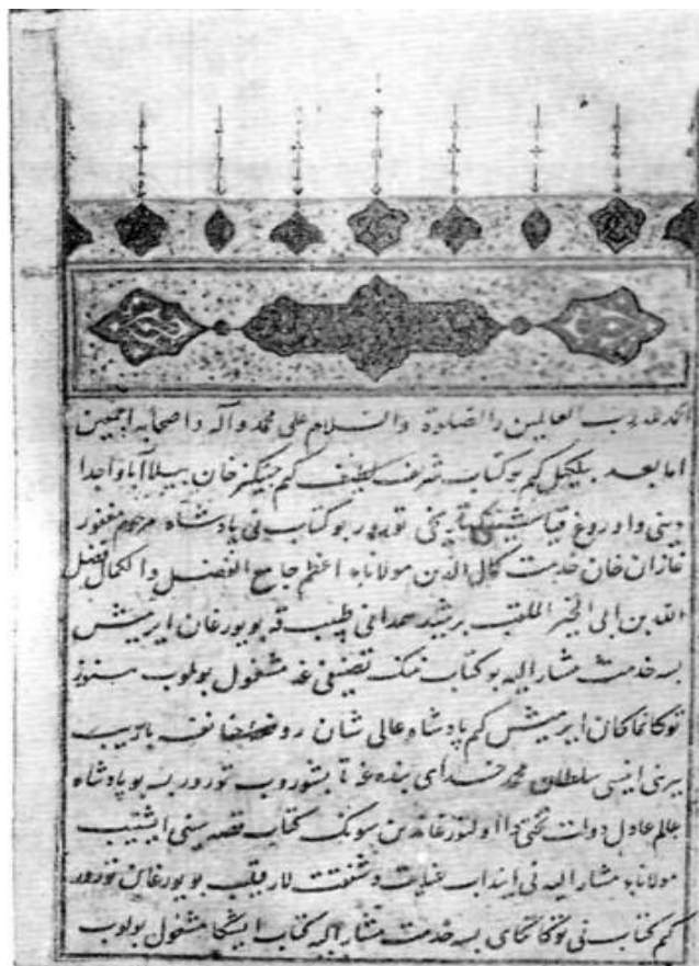
Рис. 2 Джамии' ат-таварих, л. 16.

Значение «Джами' ат-таварих» для изучения истории тюрков и монголов было высоко оценено и современниками Рашид ад-Дина, и последующими поколениями исследователей. В XVI веке по указанию Шейбанида Кучкунджи-хана (916/1510-936/1530) сочинение «Джами' ат-таварих» было переведено на чагатайский язык и дополнено новыми сведениями. Автор перевода Мухаммад 'Али ибн Дарвиш 'Али Бухари.