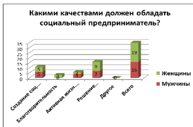
Диаграмма 2. По Вашему мнению, какие качества должен сочетать в себе социальный предприниматель?

Среди наиболее важных качеств социального предпринимателя опрошенные склонны