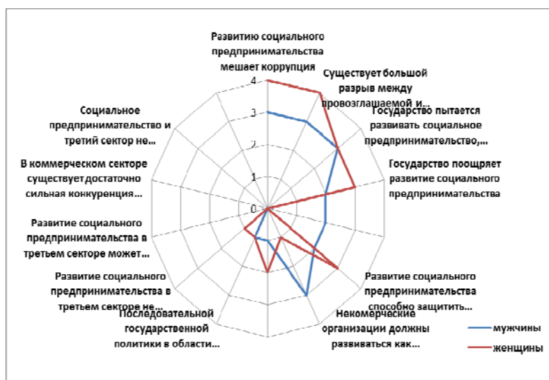
Диаграмма 4. С какими из нижеперечисленных мнений о ситуации с развитием социального предпринимательства в РК Вы согласны?

Как видно по диаграмме, можно составить рейтинг наибольших предпочтений респондентов. Рейтинг снижается по мере убывания предпочтений.