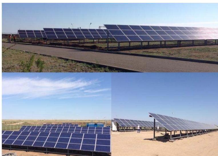
Рисунок 5 – Фотоэлектрические станции в Казахстане (пояснения в тексте)

В дальнейшем целесообразно планировать как создание автономных фотоэлектрических станций в местах, не имеющих доступа к централизованному обеспечению электроэнергией, так и целью увеличения надёжности и безопасности гидро- и атомных энергетических станций, создание комплексных станций, включающих гидро- и солнечные, атомные и солнечные станции. Для этого необходимо снижать стоимость фотоэлектричества, т.е. в первую очередь материалов и технологий получения солнечных элементов.