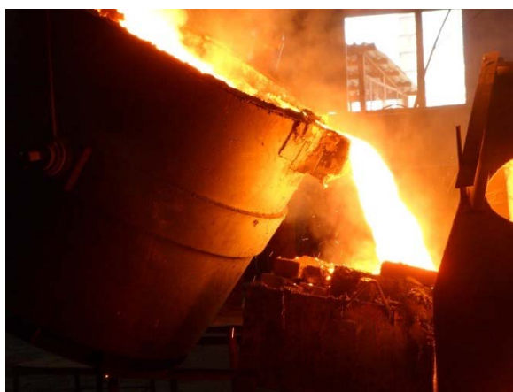
Рисунок 3 – Процесс слива МК на «KazSilicon»