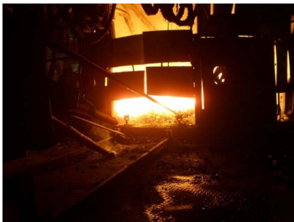
Рисунок 2 – Metallургическая печь «KazSilicon»

(рис. 1) и электродуговая печь производства КНР (рис. 2, 3).