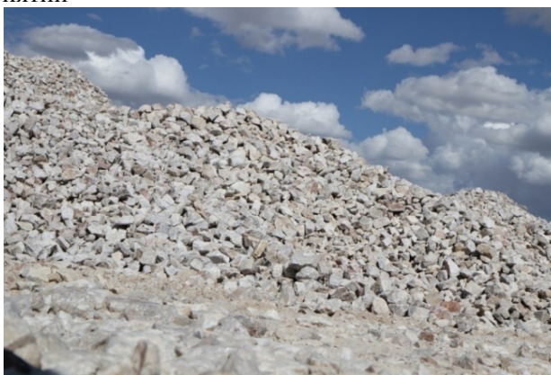
Рисунок 1 – Сарыкольское месторождение кварца

Металлургический кремний (МК) является исходным материалом для получения полупроводникового кремния, как для ФЭ, так и для электроники в целом. Промышленное производство МК осуществляется путем восстановления кварца углеродом и достаточно хорошо отлажено. В Казахстане имеется ряд кварцевых месторождений, однако по содержанию трудно удаляемых примесей, наиболее подходящим для ФЭ является Сарыкольское месторождение кварца (рис. 1) [4]. Это месторождение по праву считается одним из лучших в мире, т.к., например, содержание бора в этом кварце почти на порядок меньше, чем в МК. Для получения МК на отечественном предприятии