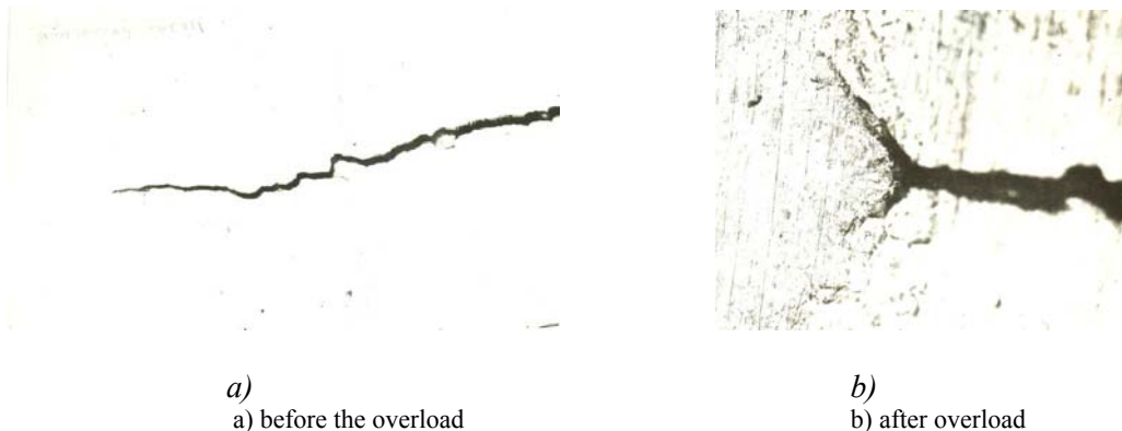
Figure 2: The top of the fatigue crack

Results and discussion. Overload leads to a significant disclosure to the crack tip blunting and vetvlienyu Usti cracks in the vicinity of which is highly developed plastic zone (Figure 2).