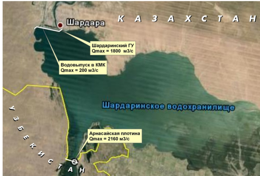
Рисунок 1 – Космический снимок Шардаринского гидрокомплекса

Исследование вертикальных смещений земной поверхности территории Шардаринского гидрокомплекса на основе данных РСА интерферометрии. При выборе исходных данных для территории Шардаринского водохранилища, в первую очередь, учитывался временной диапазон и достаточно равномерные промежутки времени между снимками. Подходящие данные, по выбранным критериям, были найдены в архиве европейского спутника SENTINEL1 ( https://scihub.copernicus.eu/ ), длина зондирующей волны спутника L=23,5 см. Исходный архив из 14 снимков спутника SENTINEL1 представлен на рисунке 2, где показана область покрытия снимками и даты снимков. Как видно из рисунка 2, временное покрытие распределено недостаточно равномерно (количество снимков за год сильно варьируется), количество зимних снимков составляет почти 50% от общего объема.