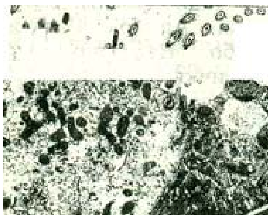
Рисунок 3 - Большая доза сигаретного дыма. Полное оводнение и просветление гиалоплазмы реснитчатой клетки. Электроннограмма x 21500

При воздействии больших доз сигаретного дыма клеточная проницаемость эпителиальных клеток усиливалась. Наблюдалось резкое нарастание процесса микро-пиноцитоза, вакуолизация и деструкция канальцев гранулярного эндоплазматического ретикулума. В зависимости от степени нарушения клеточной проницаемости происходило частичное или полное оводнение и просветление гиалоплазмы (рис.3).