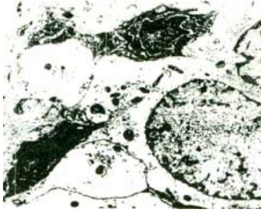
Рисунок 4 - Большая доза сигаретного дыма. Парциальный некроз эпителиальных клеток трахеи. Электроннограмма x 14000

На базальной мембране сохранялись лишь единичные базальные клетки с нормальной ультраструктурой. Бокаловидные клетки в меньшей степени подвергались разрушению, по сравнению с реснитчатыми клетками [20]. Следует подчеркнуть гиперплазию и активацию комплекса Гольджи, направленных на усиление секреторной функции бокаловидных клеток.