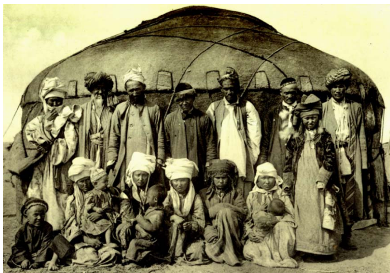
Сурет 1 - Орама кимешек киген келіншектер. Қызылқұм қазақтары. ҚР MOM қоры

Кимешектің аймақтық ерекшеліктері. Қазақ әйелдерінің кимешек киюі және оның сыртынан шылауыш тартуы әр өңірде әртүрлі.