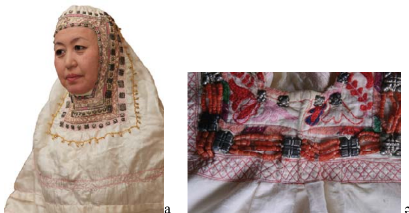
Сурет 5 - а) Жетісу өңірі кимешегі. ОМЭЭ материалдарынан; ә) Жетісу өңірі кимешегінен фрагмент. ҚРМОН қорынан (25448/54)

Кимешекті қолданатын қырғыз халқында күндігі үлкен, биік келеді, ал түрікмен халқы басқа оралған ішкі жаулықтың сыртынан үлкен жаулықты бос тастайды [13, с.101].