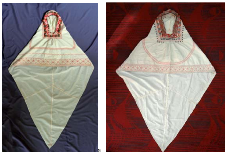
Сурет 7 - а) Кимешек. ҚР MOM қорынан (КП 14220); ә) Кимешек. ҚР MOM қорынан (25448/54)

ҚРМOM қорындағы (КП 14220) К.-нің өңірі мен басты жауып тұратын бөлігі екі қабатталып тұтас пішілген, төбесі бөлек пішіліп, қондырылған. К.-тің артқы бөлігі төрт бөлек етіп пішіліп, жалаң қабат матадан тігілген. Бет ойығы трапеция пішінді, жиегіне қызыл зермен көгеріс өрнегі түсірілген, алқым тұсына бүрме салынған. Мандай, шықшыт бөлігіне ұсақ шытыралар қондырған. Өңіржиегі қосарланған кереге тігіс пен сағатбау түрінде сырыла жиектелген. Барлық тігістер қызыл жіппен түсірілген [4; 6, 93-98 бб.]