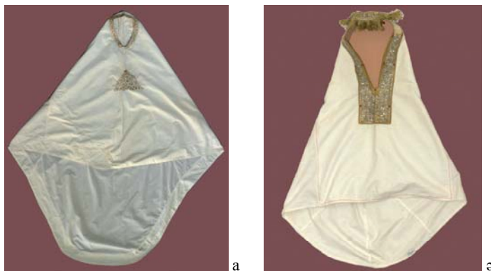
Сурет 6 - а) Кимешек. ҚР MOM қорынан (КПД 271); ә) Кимешек. ҚР MOM қорынан (КП 18083)

Кимешектің музейлік сипаттамасы. ҚР MOM қорындағы (КПД 271) кимешектің алдыңғы жағы үш, артқы жағы бес бөліктен тұратын мақта матадан тігілген. Бас, иық, желке тұстарына астар салынған, ал құйрық бөлігі доғалданып және бір қабат матадан тігілген. Төбе бөлігі бөлек пішіліп, бүрмеленіп салынған. Кимешектің бет ойығы зооморфтық өрнектер негізінде зер жіппен жиектелген. Өңіріне де үшбұрыш пішінінде зооморфтық өрнек зер жіппен кестеленген. Етегі айнала бүгіліп, сырылып тігілген.