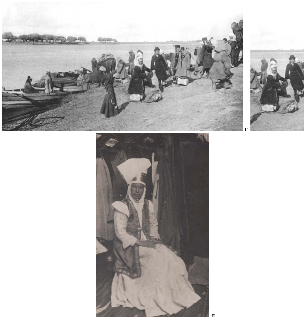
Сурет 4 - а-д) Зер таспалы кимешекті әйелдер, а-ғ - [10-11]; д - ҚРММ қоры (ФКП22)

Кимешектің тағы бір түрін ұзындығы енінен екі есе ұзын матаның ұзын жағына екі шетінен бүктеп екі жағынан тігетін болған. Екі қабат матадан тұратын шаршының бір жағы кимешектің алдыңғы бөлігі, екінші ұшы артқы жағына түскен. Оның тігілмеген төменгі бөлігін кесіп, жарты шеңберлік түрге келтірген, ал жоғарғы бөлігінен бетке орын ашқан. Төбеге келетін бұрышты аздап кесіп соған қайтадан тігіп бекіткен құраған. Кимешек төбесінен, жоғарғы бөлігінен «күндік» қызметін атқаратын жаулық оралған. Күндік бөлігінің қызметі басты қыста суықтан қорғау, жазда ыстықты өткізбеу болып саналады. Бұл қыста суық, жазды аптап ыстықтан қорғаған. Кимешектің сыртынан тартатын жаулық шылауыш , шаршы деп аталған.