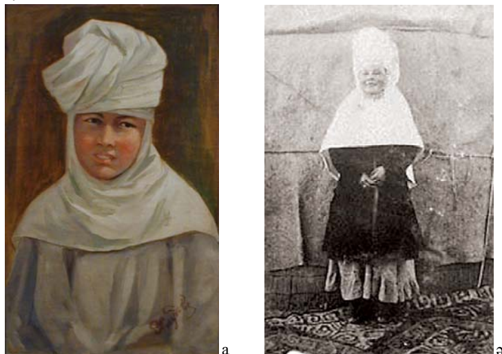
Сурет 2 - а) Орама кимешек. Н. Г. Хлудов. ҚР MOM қорынан КП (3655); ә) Орама кимешек. ҚРМOM. ФКП

Орама кимешек Солтүстік Қазақстанда, Ақмоланың батысында және Оңтүстік пен Сыр бойында кең таралған.